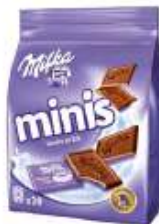
Milka Minis Tendre au lait 10x20g