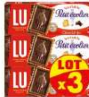
Petit Ecolier chocolat noir x3