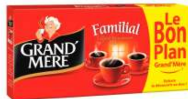
Grand-mère Familial 4x250g Le bon plan