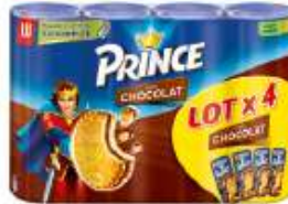
Prince chocolat 4x300g