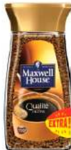
Maxwell House Qualité Filtre Normal 200g opération