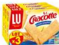
Cracotte céréales complètes x3