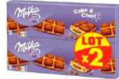
Milka Cake and choc 2x175g