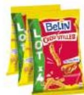
Croustilles cacahuète 4x140g