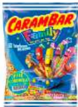
Carambar Family 481g Offre Economique