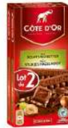
Côte d'Or Lait Eclats Noisettes 2x200g