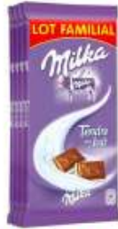
Milka Tendre au Lait 4x100g