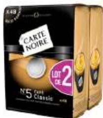
Carte Noire dosettes N°5 Classic 2x48