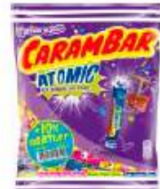
Carambar Atomic 242g +10% gratuit