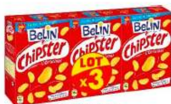
Belin Chipster 3x75g