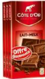
Côte d'Or Lait 3x100g Offre gourmande