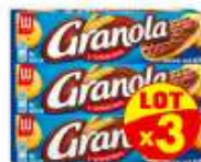
Granola chocolat au Lait x3x200g