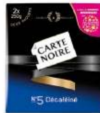
Carte Noire Décaféiné 2x250g opération