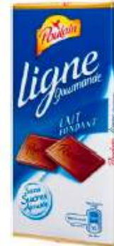
Poulain Ligne gourmande Lait 100g