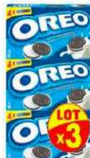
Oreo pocket 3x176g