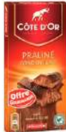
Côte d'Or Praliné Fondant Lait 200g Offre gourmande