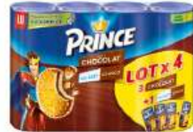
Prince Chocolat 4x300g : 3 choco + 1 lait