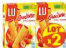
Cracotte craquINETTE fraise 2x200g