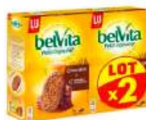
Belvita Chocolat 2x400g