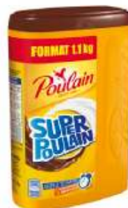
Super Poulain 1,1kg