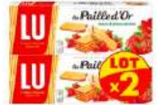
La Paille d'Or aux Fraises 2x170g