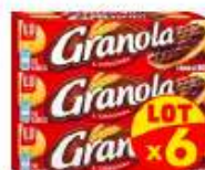
Granola chocolat Noir x6x195g