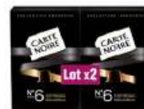
Carte Noire Collection Espresso n°6 2x53