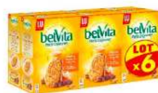
Belvita Miel et Pépites de chocolat 6x435g