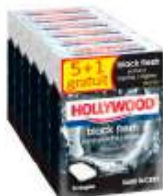
Hollywood Black Fresh x6 5+1 gratuit