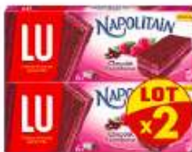
Napolitain Napit Framboise 2x174g