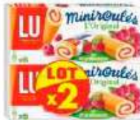
Mini roulés framboise 2x150g