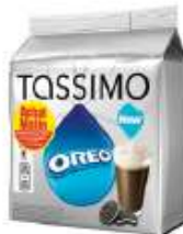
TASSIMO Oreo Achat Mallin