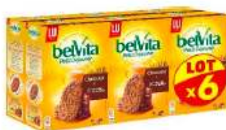
Belvita Chocolat 6x400g