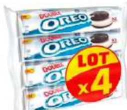
Oreo Double rouleau 4x157g