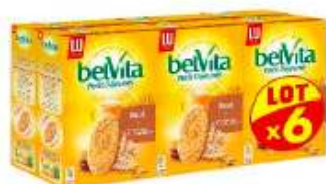
Belvita Brut de céréales 6x400g