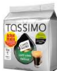
TASSIMO Carte Noire café long Délicat Achat Mallin