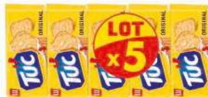
TUC Original 5x100g