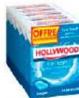
Hollywood Ice Fresh x5 Offre Economique