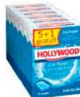
Hollywood Ice Fresh x6 5+1 gratuit