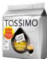
TASSIMO Carte Noire Espresso Classic Achat Mallin