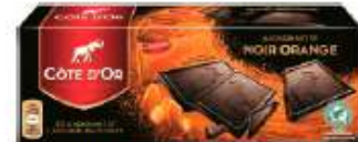
Côte d'Or Mignonette Noir Orange 140g