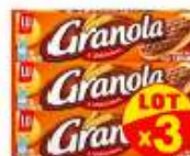
Granola chocolat au Lait Caramel x3x200g