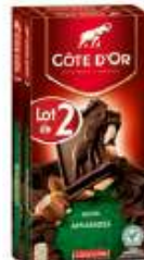
Côte d'Or Bloc Noir Amandes 2x200g