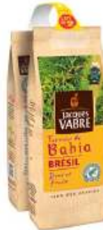
Jacques Vabre Bahia 2x250g