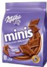
Milka Minis 10x20g