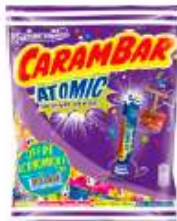
Carambar Atomic 326g Offre Economique