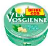
La Vosgienne Menthe Fraiche 125g Offre Economique