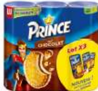
Prince Chocolat 3x300g