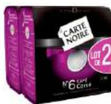
Carte Noire dosettes N°6 Corsé 2x36