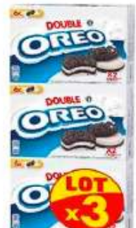
Oreo Double pocket 3x170g