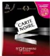
Carte Noire Espresso 2x250g opération