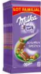
Milka Lait Noisettes Entières 6x100g