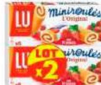
Mini roulés fraise 2x150g