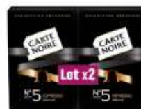
Carte Noire Collection Espresso n°5 2x53