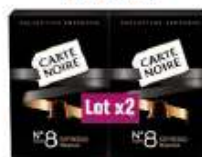
Carte Noire Collection Espresso n°8 2x53