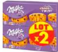
Milka Choco Twist 2x140g