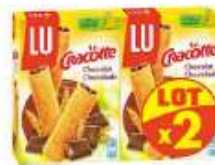
Cracotte craquINETTE chocolat 2x200g