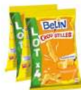
Croustilles fromage 4x140g