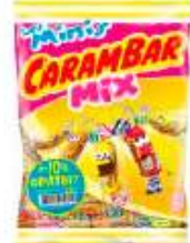
Carambar Minis Mix 242g +10% gratuit