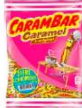
Carambar Caramel 470g Offre Economique