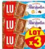
Petit Ecolier chocolat lait x3