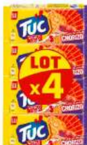
TUC Chorizo 4x100g