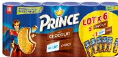
Prince Chocolat 6x300g : 5 chocolat + 1 lait