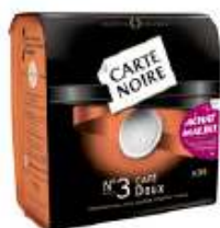
Carte Noire dosettes N°3 Doux x36