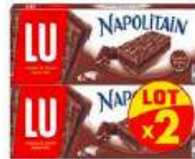
Napolitain Napit Chocolat 2x174g