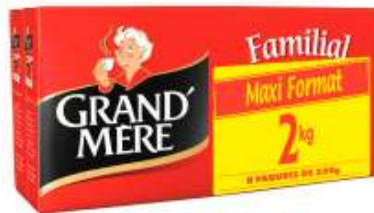
Grand-mère Familial 2x4x250g