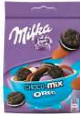
Milka Oreo Chocomix Snax 146g