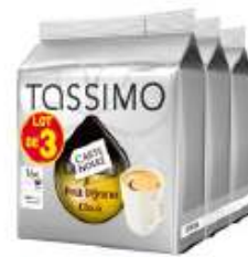
TASSIMO Carte Noire Petit Déjeuner Classic Lotx3