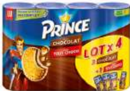
Prince Chocolat 4x300g : 3 choco + 1 tout choco