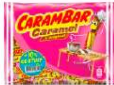
Carambar Caramel 352g +10% gratuit