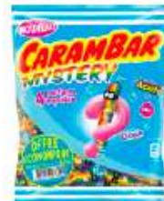
Carambar Mystery 326g Offre Economique