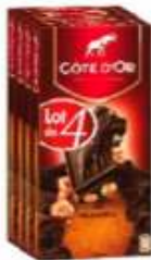
Côte d'Or Bloc Noir Noisettes 4x200g