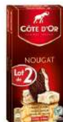
Côte d'Or Fourré noir nougat 2x130g