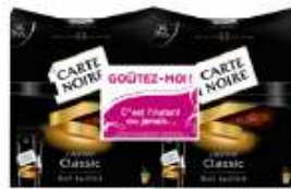
Carte Noire L'Instant sticks 2x45g