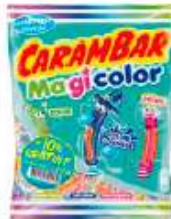
Carambar Magicolor 242g 10% gratuit