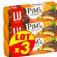
Pim's Orange 3x150g