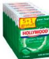
Hollywood Green Fresh x6 5+1 gratuit