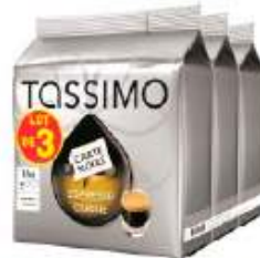
TASSIMO Carte Noire Espresso Classic Lotx3