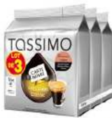
TASSIMO Carte Noire Café long Classic Lotx3