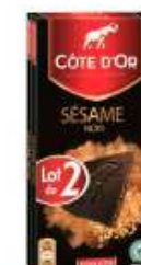
Côte d'Or Noir Sésame 2x100g