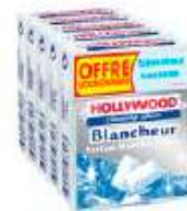
Hollywood Fresh Menthe Polaire x5 Offre Economique