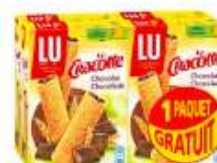
Cracotte craquINETTE chocolat 4x200g dont 1 gratuit