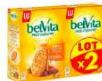
Belvita Miel et Pépites de chocolat 2x435g