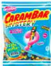
Carambar Mystery 242g +10% gratuit