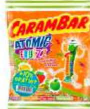
Carambar Atomic Fruiz 242g +10% gratuit