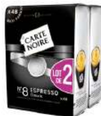
Carte Noire dosettes N°8 Espresso 2x48