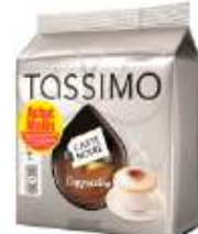
TASSIMO Carte Noire Cappuccino Achat Mallin