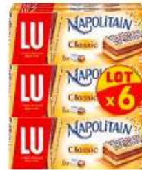
Napolitain Individuel Classic x6