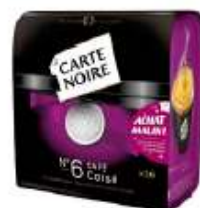
Carte Noire dosettes N°6 Corsé x36