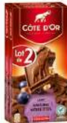
Côte d'Or Bloc Lait Raisins Noisettes 2x200g