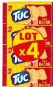
TUC Bacon 4x100g