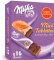
Milka Mini Tablettes 16x29g