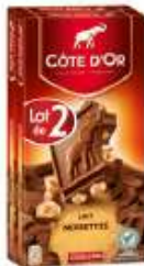
Côte d'Or Bloc Lait Noisettes 2x200g