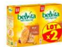
Belvita Brut de céréales 2x400g