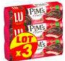
Pim's Framboise 3x150g