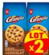
Granola Cookies Chocolat x2