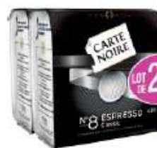
Carte Noire dosettes N°8 Espresso 2x36