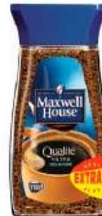
Maxwell House Qualité Filtre Décaféiné 200g opération