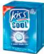
Kiss Cool Menthe Forte 2x17g