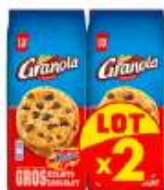
Granola Cookies Eclats Dalm x2