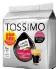
TASSIMO Carte Noire café long Intense Achat Mallin