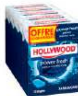
Hollywood Power Fresh x5 Offre Economique