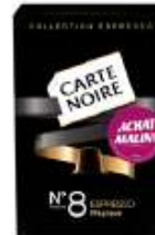
Carte Noire Collection Espresso n°8 Achat Malin