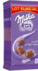
Milka au Lait du Pays Alpin 5x100g