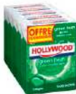
Hollywood Green Fresh x5 Offre Economique