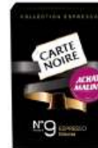
Carte Noire Collection Espresso n°9 Achat Malin