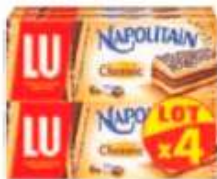
Napolitain Individuel Classic x4