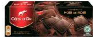
Côte d'Or Mignonette Noir de Noir 140g