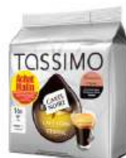
TASSIMO Carte Noire café long Classic Achat Mallin