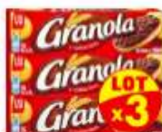
Granola chocolat Noir x3x195g