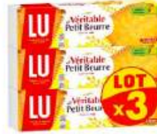
Véritable Petit Beurre 3x200g