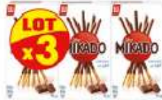
Mikado chocolat au lait x3