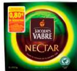
Jacques Vabre Nectar 2x250g