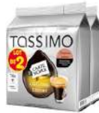
TASSIMO Carte Noire Café long Classic Lotx2