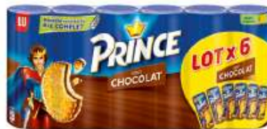
Prince Chocolat 6x300g