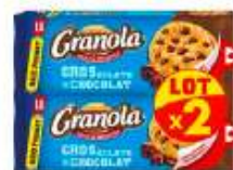
Granola Cookies Chocolat x2