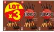
Mikado chocolat noir x3