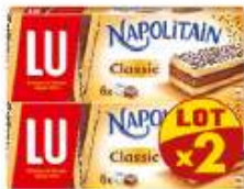
Napolitain Individuel Classic 2x180g