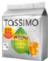
TASSIMO Twinings Thé vert Achat Mallin