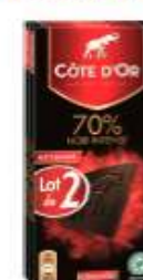
Côte d'Or Noir 70% 2x100g