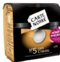
Carte Noire dosettes N°5 Classic x36