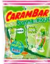
Carambar Pomme 242g +10% gratuit