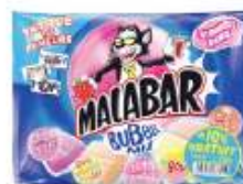
Malabar Bubble Mix 236g +10% gratuit