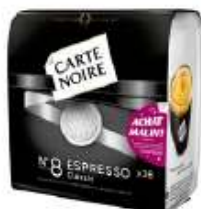
Carte Noire dosettes N°8 Espresso x36