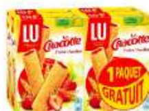
Cracotte craquINETTE fraise 4x200g dont 1 gratuit