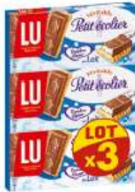
Petit Ecolier Tendre cœur 3x120g