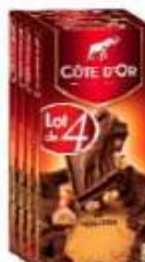
Côte d'Or Bloc Lait Noisettes 4x200g