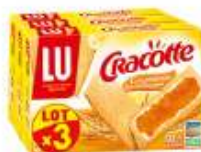
Cracotte gourmande x3