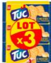
TUC Cheese 3x100g