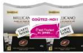
Carte Noire Millicano sticks 2x45g