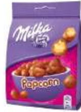
Milka Popcorn Snax 130g