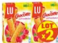
Cracotte craquINETTE framboise 2x200g