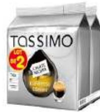
TASSIMO Carte Noire Espresso Classic Lotx2