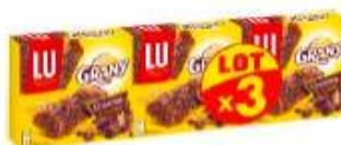
Barres Céréales Grany Chocolat 3x125g