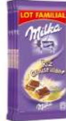
Milka Riz Croustillant 4x100g