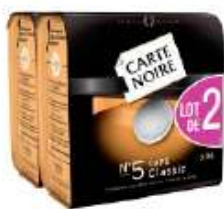
Carte Noire dosettes N°5 Classic 2x36