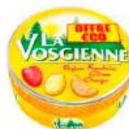
La Vosgienne Mix Fruits 125g Offre Economique