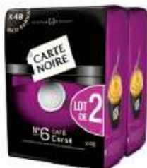
Carte Noire dosettes N°6 Corsé 2x48