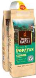
Jacques Vabre Popayan 2x250g