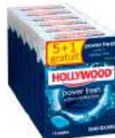
Hollywood Power Fresh x6 5+1 gratuit