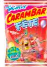
Carambar Minis Fete 352g Offre Economique