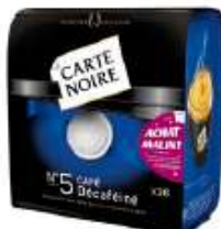
Carte Noire dosettes N°5 Classic Décaféiné x36