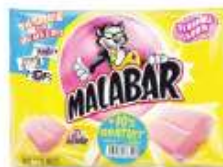
Malabar Tutti 236g +10% gratuit