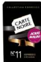
Carte Noire Collection Espresso n°11 Achat Malin