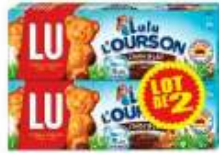
Courson chocolat LU 2x150g