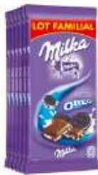
Milka Oreo 6x100g