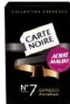
Carte Noire Collection Espresso n°7 Achat Malin