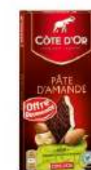
Côte d'Or Fourré Noir Pâte d'amandes 150g Offre gourmande