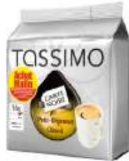
TASSIMO Carte Noire Petit Déjeuner Classic Achat Mallin