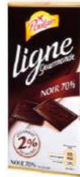
Poulain Ligne gourmande Noir 70%