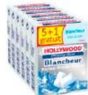
Hollywood Fresh Menthe Polaire x6 5+1 gratuit