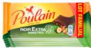
Poulain Noir Extra Noisettes 5x100g