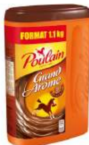
Poulain Grand Arôme 1,1kg