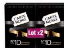
Carte Noire Collection Espresso n°10 2x53