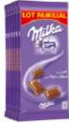
Milka au Lait du Pays Alpin 6x100g