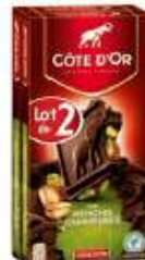
Côte d'Or Bloc Noir Pistaches Caraméllées 2x200g