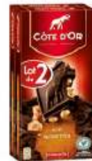
Côte d'Or Bloc Noir Noisettes 2x200g