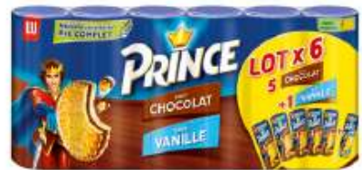
Prince Chocolat 6x300g : 5 chocolat + 1 vanille