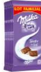
Milka Tendre au Lait 6x100g