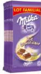
Milka Riz Croustillant 6x100g