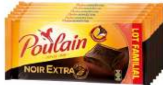
Poulain Noir Extra 6x100g