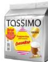
TASSIMO Carambar Achat Mallin