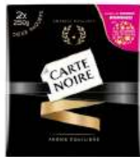
Carte Noire Moulé 2x250g opération