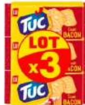
TUC Bacon 3x100g