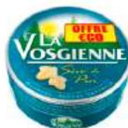
La Vosgienne Sève des Pins 125g Offre Economique