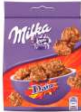
Milka Dalm Snax 145g