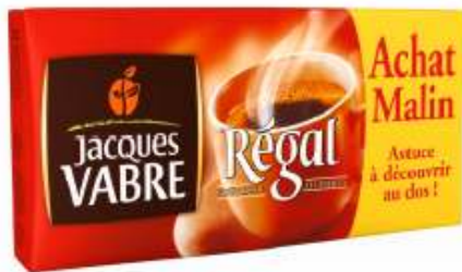
Jacques Vabre Régál 4x250g Achat Malin