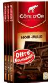
Côte d'Or Noir 3x100g Offre gourmande