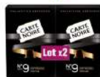
Carte Noire Collection Espresso n°9 2x53