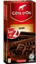
Côte d'Or Noir 2x200g