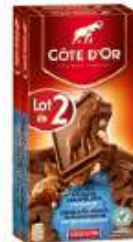
Côte d'Or Bloc Lait Amandes Craméllées 2x200g