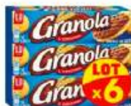
Granola chocolat au Lait x6x200g