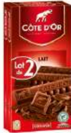
Côte d'Or Lait 2x200g