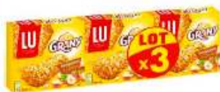
Barres Céréales Grany Noisettes 3x125g