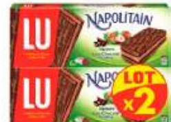
Napolitain Napit Praliné 2x174g