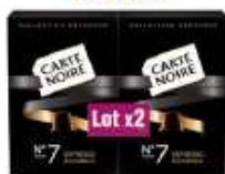
Carte Noire Collection Espresso n°7 2x53