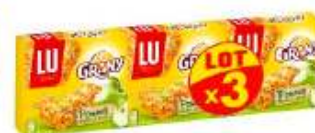
Barres Céréales Grany Pomme Verte 3x125g