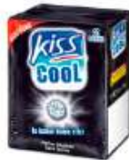
Kiss Cool Réglisse 2x17g