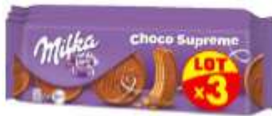
Milka Choco Supreme 3x180g