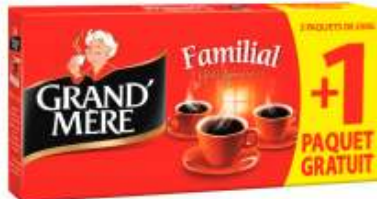
Grand-mère Familial 4x250g 3x250g +1 gratuit