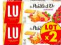
La Paille d'Or aux Framboises 2x170g