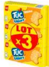
TUC Crispy 3x100g