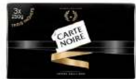
Carte Noire 3x250g