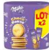
Milka Choco Pause 2x260g