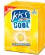
Kiss Cool Citron 2x17g