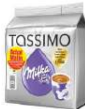
TASSIMO Milka Achat Mallin