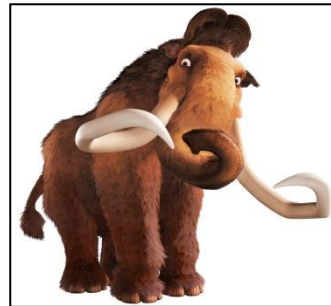
Couple de cartes n°4