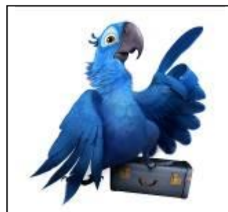
Couple de cartes n°5