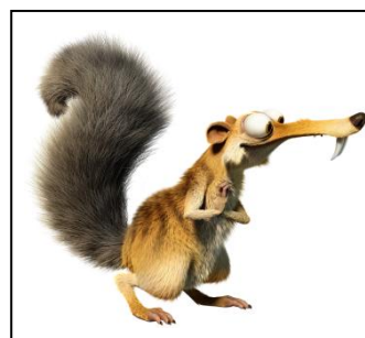
Couple de cartes n°6