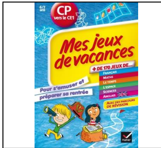
Couple de cartes n°1

Le jeu : clique sur les cartes pour les retourner, constitue des paires le plus vite possible et en un minimum de clics.