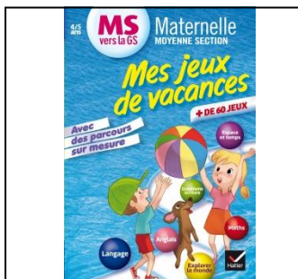
Couple de cartes n°2